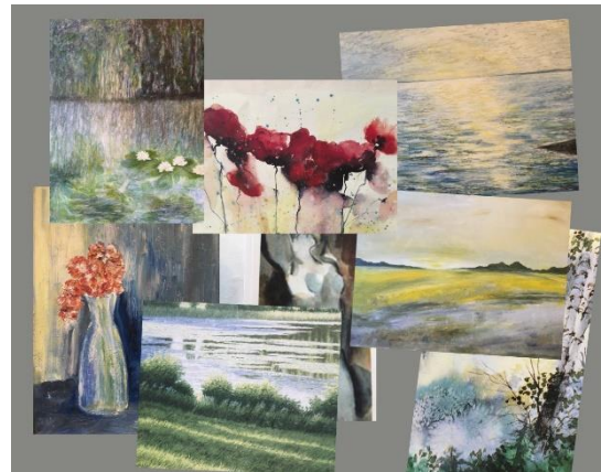
Atelje' Torsslund (43)

Tag nu vägen mot Kärnebygd. Efter en stund kommer Cykelleden Ätranbaneleden, tag den åt vänster.