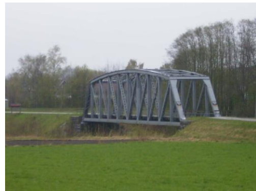
Foto Järnvägsbron i Ätran

Nu tar man Ätranbaneleden tillbaka till Ätran. Denna cykelled går mellan Ullared och Fegen. Den följer de gamla järnvägsvallarna efter Varberg-Äträs respektive Fegen-Äträs